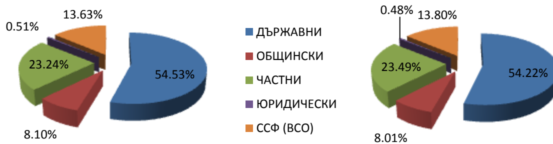
Фиг. 1: Разпределение на горите по форма на собственост

Малко над половината от горския фонд е държавна собственост, 23% от горите са частни, а общински – малко над 8%. Около 14% са временно стопанисваните от общината, със статут на съществуваща собственост преди възстановяване. Около половин процент са собственост на юридически лица.