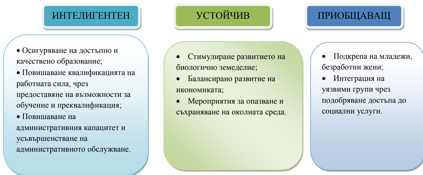
Фигура 2. Съответствие на ОПР на община Априлци със стратегията „Европа“ 2020 2

Към целите са дефинирани и седем водещи инициативи, предоставящи рамка, чрез която ЕС и националните власти взаимно поддържат усилията си в области, подкрепящи приоритетите на „Европа 2020“ – като иновации, цифрова икономика, заетост, младеж, промишлена политика, бедност и ефективно използване на ресурсите. Според оценителя Общинският план за развитие на община Априлци следва създадените от ЕС насоки (вж. фиг. 2):